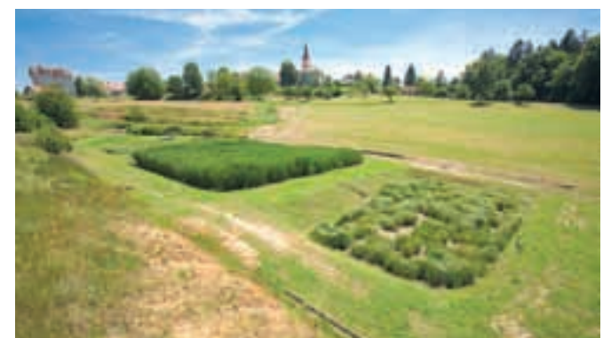
Rastlinska čistilna naprava Sveti Tomaž 250 PE v občini Sveti Tomaž

Vsaka RČN potrebuje primarni usedalnik, ki je lahko že obstoječa greznica (shema). Sestavljajo jo tudi grede, postavljene druga za drugo. Grede so izolirane z nepropustno folijo in napolnjene z različnimi frakcijami peska (substratom). V substrat posajene vlagoljubne rastline, kot so na primer navadni trs, ločje ali šaš, so v kombinaciji z mikroorganizmi sposobne očistiti odpadno vodo do zahtevanih normativov. RČN iz vode odstranjujejo organske snovi, spojine dušika, fosforja, težkih kovin in druge snovi, zato govorimo o terciarnem čiščenju. Učinkovito zmanjšujejo tudi število fekalnih