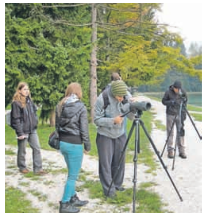
Šobec je imeniten kraj za opazovanje različnih vrst ptic.

»V okviru 20. Evropskega dneva opazovanja ptic smo opazovali ptice selivke in spoznali pomen varovanja njihovega, hkrati pa tudi našega okolja, in to ravno v obdobju, ko se ptice selijo proti jugu, v svoja prezimovališča. Hkrati je bil dogodek tudi priložnost za druženje vseh, ki jih zanimajo ptice in narava okoli nas,« so zadovoljni na Društvu za opazovanje in proučevanje ptic Slovenije. »Opazili smo velike jate mlakaric, golobov grivarjev, škorcev in ščinkavcev. Najbolj zanimiva so bila opazovanja zadnjih kmečkih lastovk zamudnic na poti v Afriko ter prvih velikih srakoperjev in sokoličev, ki pridejo s severa