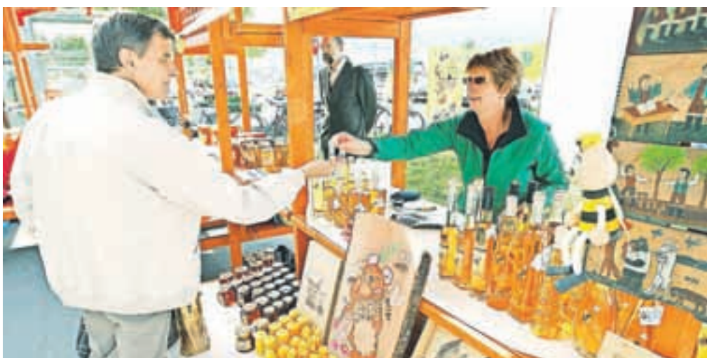
Polne stojnice so privabljele obiskovalce od blizu in daleč.

na Halačevića, sladoled z medom, ki so ga posebej za festival medu pripravili v leški slaščičarni Ježek, in medeno pivo. Na stojnicah pred centrom so čebelarji prodajali čebelje produkte; med boljše založenimi je bila tudi stojnica čebelarstva krožka OŠ F. S. Finžgarja Lesce, kjer imajo enega najdejavnejših čebelarstvih podmladkov v državi.