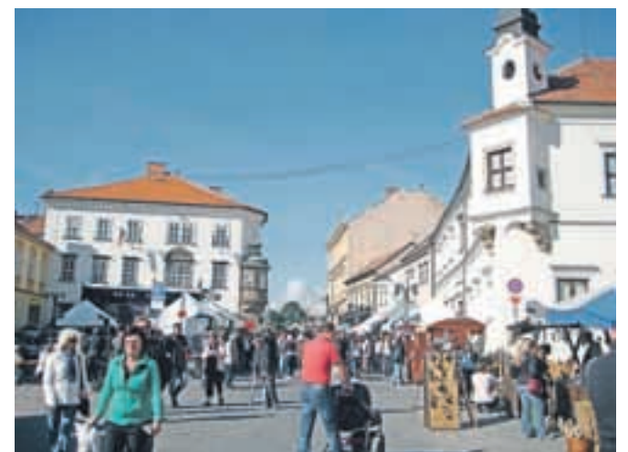
Ivančice, rojstno mesto Linhartovega očeta in slavnega slikarja Alfonsa Muche