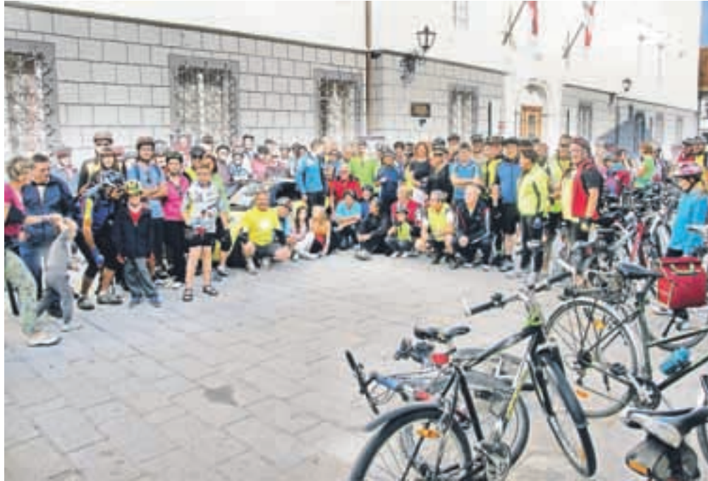
»Gasilska« fotografija kolesarjev pred startom na Linhartovem trgu

Med pomembne znane dejavnike, ki onesnažujejo Zemljo, lahko povsem mirno štejemo avtomobile. Kako preprečiti, da bi avtomobili spuščali pline v zrak? Težko. Z dnevom brez avtomobila damo tudi delež k čistejšemu zraku. Kaj lahko naredimo čez leto? Namesto z avtomobilom se na krajše razdalje odpravimo peš, kolesom. Uporabljajmo javna prevozna sredstva. Če se le da, naj se na delo vozi več ljudi skupaj, za prevoz več otrok v šolo in razne aktivnosti naj se organizirajo starši in naj vozi eden več otroki. Podatek, da povprečen slovenski avto na leto porabi za 1400 evrov bencina in izpusti v zrak 3,120 kg ogljikovega dioksida, nikakor ni optimističen.