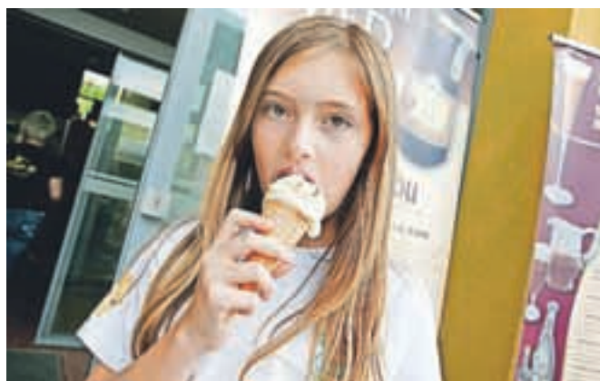
Predvsem najmlajši so bili navdušeni nad medenim sladoledom, ki so ga posebej za to priložnost pripravili v slaščičarni Ježek.