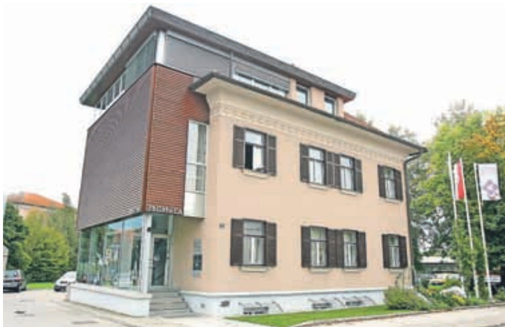
Stavbo območne obrtno podjetniške zbornice v Radovljici so po vzoru nekdanje hiše, ki je stala na tem mestu, zgradili pred dvanajstimi leti. Pred praznikom bodo pred poslopje postavili kip moža iz radovljiškega grba.