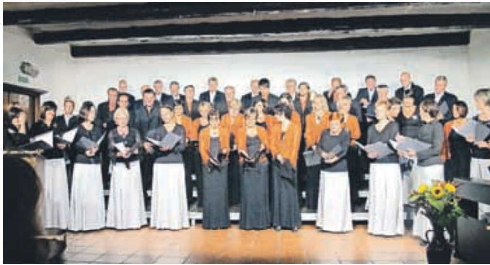
Na koncertu ob 50-letnici sodelovanja so v Kropi nastopili pevci iz Radiš in domači zbori. /