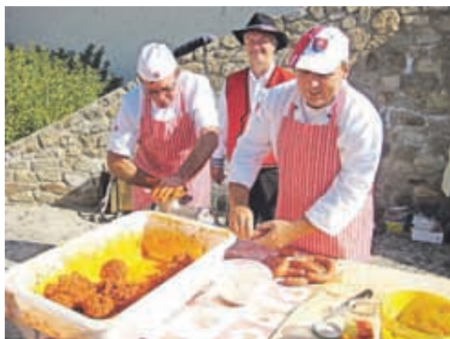
Slovaška ekipa je kar na svoji stojnici pripravljala sveže klobase, ki so jih kasneje spekli na žaru.